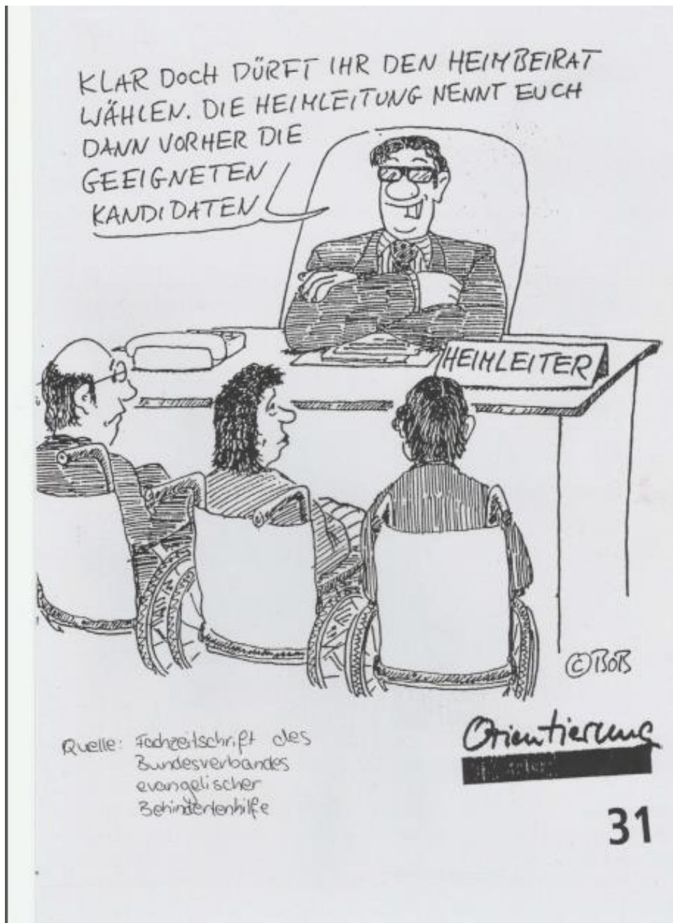
Bild vom Heimbeirat Karikatur 1